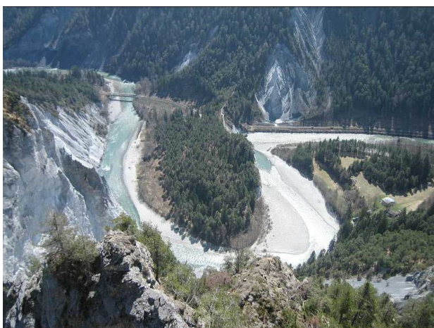
Rheinschleife in der Ruinaulta